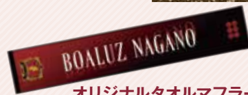
オリジナルタオルマフラー (グラデーション入り)