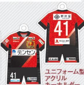
ユニフォーム型アクリルキーホルダー