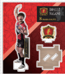
アクリルフィギア